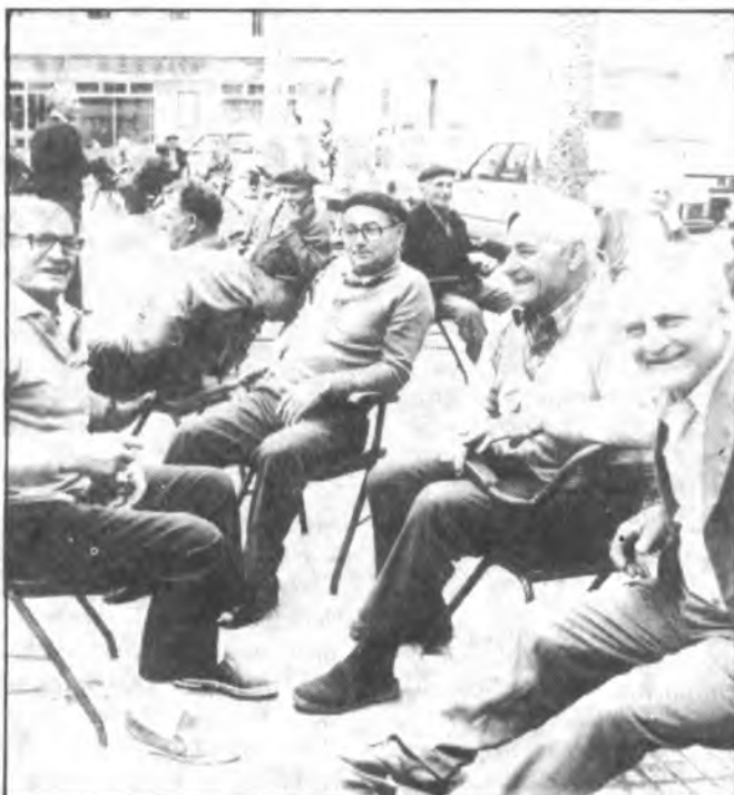
La vida poblera, colapsada por el Agosto.

vaga inquietud y algún que otro comentario.