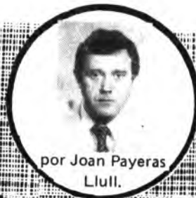
por Joan Payeras Llull.