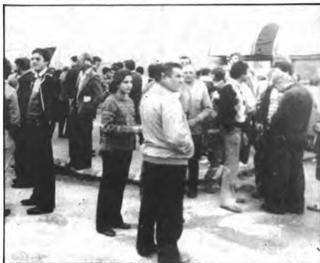
De nuevo al fútbol.

ría de los "poblers" ni siquiera se percataron de ello. La cuestión es que al día siguiente en "Radio Ba-