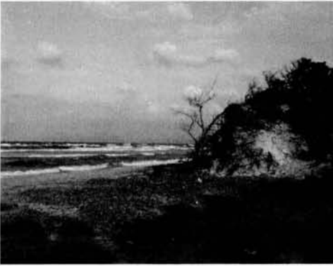
Fig. 2. Platja d'Es Comú, hàbitat d' Armadillidium album al Parc Natural de s'Albufera.

Fig. 2. Es Comú beach, hàbitat of Armadillidium album in the Albufera Natural Park.