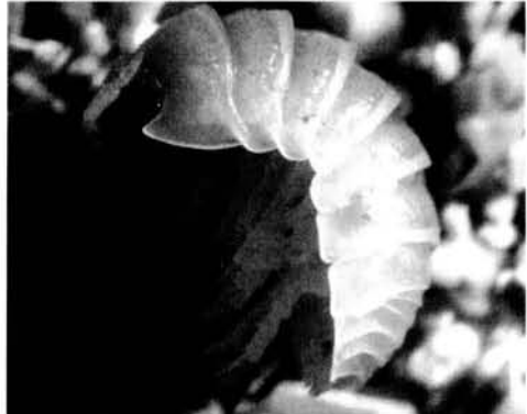
Fig. 3. Armadillidium album . Exemplar de S'Albufera de Mallorca.

Fig. 2. Es Comú beach, hàbitat of Armadillidium album in the Albufera Natural Park.