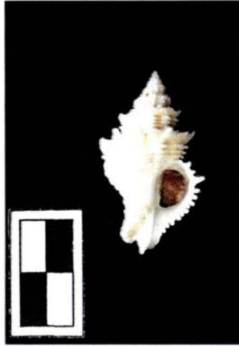
Latiaxis amaliae (Kobelt, 1907)