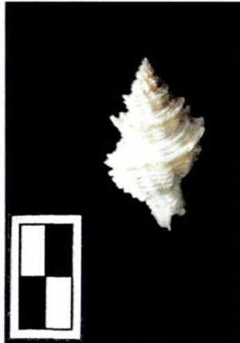
Latiaxis amaliae (Kobelt, 1907)