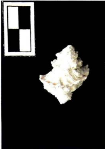
Latiaxis babelis (Requién, 1848) Bar scale 2 cn.