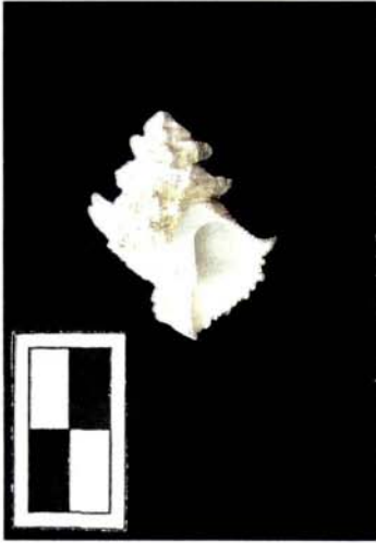
Latiaxis babelis (Requién, 1848) Escala 2 cn.