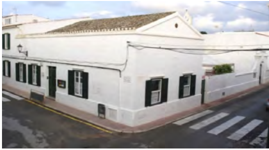
Entre els anys 1904 i 1908 es va construir un nou edifici en el carrer Sant Gabriel, que va ser un referent d'escola activa en aquella època.